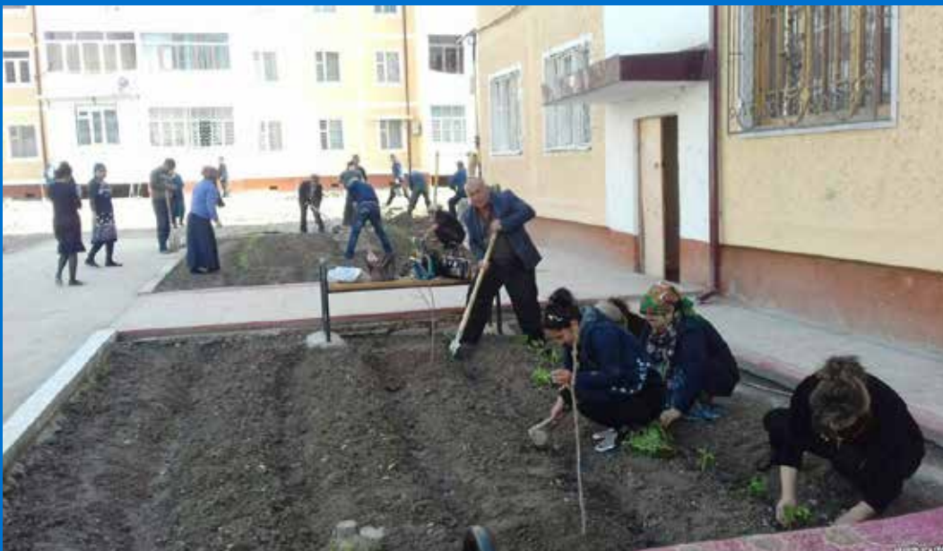
Анджон вилояти ўқитувчилари Ўзбекистон президенти Шавкат Мирзиёевнинг ташрифи арафасида жамоат жойларини сулуриб-сидиришга жўнатилди. 2018 йил 5 апрель, “Озодлик” радиоси ўзбек хизмати сурати.

UGF Берлинда жойлашган, асосий фаолияти Ўзбекистонда инсон ҳуқуқлари ҳолатини мониторинг қилиш ва ҳисобот тайёрлаш, шунингдек, мамлакат ичида ишлаётган маҳаллий фаолларни қўллаб-қувватлашга қаратилган ноҳукумат ташкилотдир. Ташкилотга ўзининг инсон ҳуқуқлари бўйича фаолияти туфайли 2006 йилда ватани Ўзбекистондан чиқиб кетишга мажбур бўлган ҳуқуқ ҳимоячиси, турли мукофотлар совриндори Умида Ниёзова асос солган ва бошқаради.