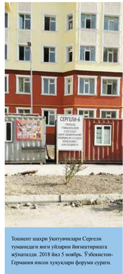
Тошкент шаҳри ўқитувчилари Сергели туманидаги янги уйлари йиғиштиришга жўнатилди. 2018 йил 5 ноябрь.

Ушбу тадқиқот ўтказилаётган пайтда Фарғона вилоятининг мансабдор шахслари, бизнингча, мажбурий меҳнатни тақиқлаш йўлида собит эди. Фарғона вилоятида май-июнь ойларида суҳбатга тортилган саккиз нафар давлат хизматчисининг барчаси апрель ойигача ўз иш жойидан ташқарида ишлашга мажбур бўлганларини билдирди. Биттасидан ташқари барчаси президент фармонидан сўнг бошлиқлар улардан мажбурий ишларга қатнашишни талаб қилишни тўхтатишганини маълум қилди. 31 Фарғоналик шифокорлардан бирининг айтишича, апрель ойидан бошлаб мажбурий меҳнатнинг айрим кўринишлари тўхтаган бўлса-да, у ишлайдиган шифохона ходимларидан бир қисми, жумладан, ҳамшираларнинг муассаса ҳудуди ва атрофидаги кўчаларни супуриш, гул экиш, бегона ўтларни тозалаш ишларига жалб этилиши давом этди. 32