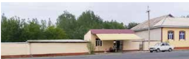
“Обод қишлоқ” дастури қабул қилинганидан сўнг бутун мамлакатдаги маҳаллий ҳокимликлар марказий кўчалар бўйларида жойлашган уйлар эгаларига ўз уйларини, худди Навоий вилоятида олинган суратдаги каби, сариқ рангга бўяш топшириғини берди. 2018 йил 11 июнь, Ўзбекистон-Германия инсон ҳуқуқлари форуми сурати.

2018 йил март ойида Мирзиёев қишлоқ турар жой фонди ва инфратузилмасини янгилаш бўйича “Обод қишлоқ” дастурини эълон қилди. Дастурга оид чиқишида президент турар жойлар яроқсиз ҳолга келиб қолгани учун “масъулиятсиз” маҳаллий амалдорларни, уй эгаларини ва қишлоқлар аҳлини (уларнинг асосий қисми қашшоқликда кун кечиради) қойиди. 62 Дастурда уйларнинг ташқи кўринишини яхшилаш, шунингдек, кўча томондан кўринадиган ёндош ҳудудларни ободонлаштиришга асосий эътибор қаратилган. Андижон, Жиззах, Хоразм, Навоий ва Самарқанд вилоятларидан бўлган давлат хизматчилари маҳаллий ҳокимликлар президент дастурини бажаришнинг барча оғирлигини давлат корхоналари зиммасига юклаганини таъкидлади. 63 Давлат сектори хизматчиларининг айтганлари тасдиғини топди: ҳокимликлар ҳар бир давлат муассасасига